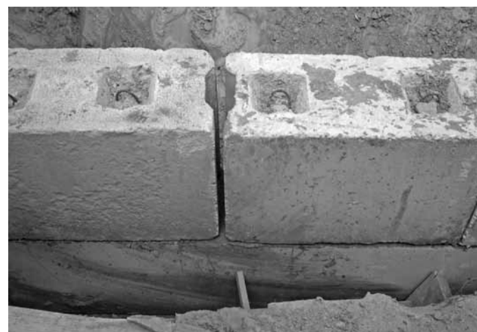
Объект: МТФ Ходоровцы. ПМК-169

Фундаментные блоки на переходных галереях уложены насухо, т.е. без раствора.