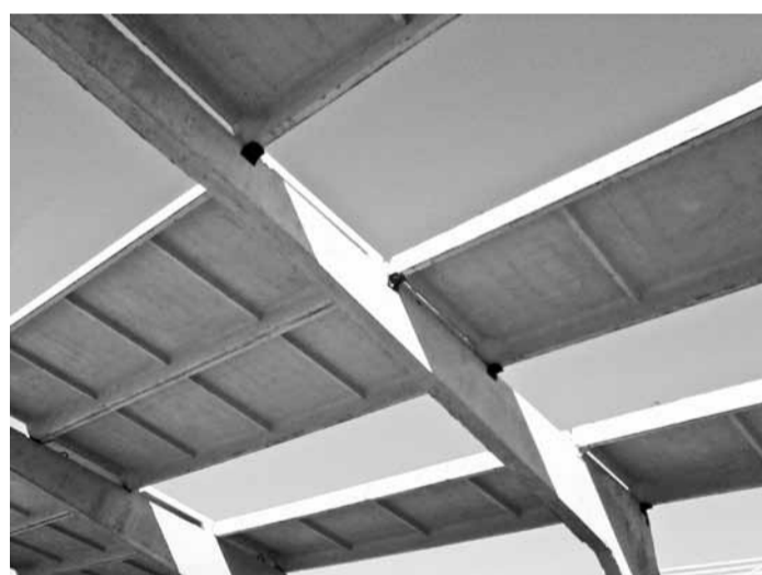
Объект: МТФ Лозы. СПМК-61

Нарушаются условия складирования железобетонных изделий (отсутствуют деревянные подкладки), что может привести к образованию трещин, сколов и поломке конструкций.