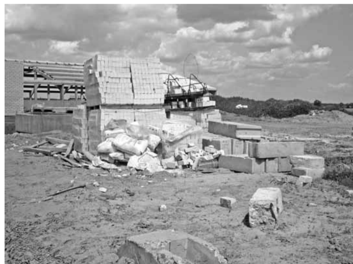
Объект: МТФ Ходоровцы. ПМК-169

Не выдержано минимальное опирание некоторых плит покрытия на полурамы (60 мм) и фактически составляет 35-50 мм, в результате чего нарушается несущая способность плит покрытия.