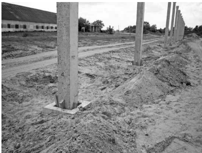
Объект: МТФ Ходоровцы. ПМК-170

Несвоевременно заделываются бетоном колонны в фундаментных стаканах