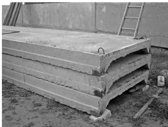
Объект: МТФ Ходоровцы. ПМК-170

Несвоевременно заделываются бетоном колонны в фундаментных стаканах